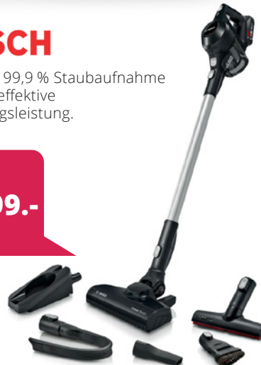
Akku-Staubsauger Unlimited, Schwarz, B45611MALL

Das leistungsstärkste Bügelsystem Bügeln war noch nie so effizient und mühelos. Die leistungsstärkste Dampfbügelstation liefert professionelle Bügelergebnisse – dank leistungsstarker Dampfkraft.