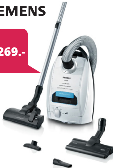
Staubsauger inkl. 16 Beutel, Q5.0 extreme silencePower Weiß, VSQ5X12M1