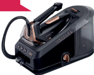
CareStyle 7 Pro Dampfbügelstation, Schwarz, IS 7286 BK