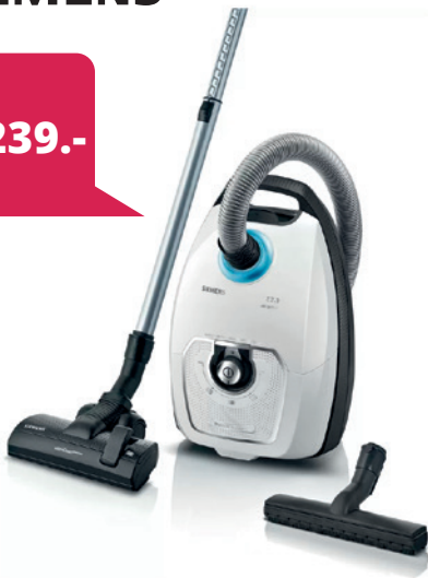
Staubsauger inkl. 16 Beutel, Weiß, VSZ7442S