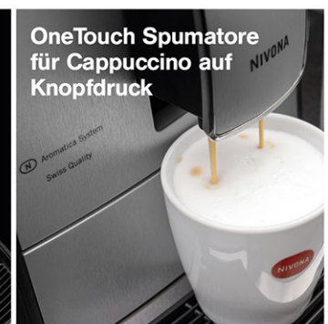
OneTouch Spumatore für Cappuccino auf Knopfdruck