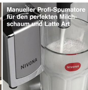
Manueller Profi-Spumatore für den perfekten Milch- schaum und Latte Art