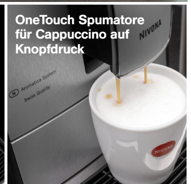
OneTouch Spumatore für Cappuccino auf Knopfdruck