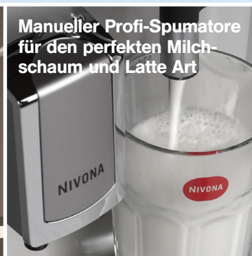
Manueller Profi-Spumatore für den perfekten Milchschaum und Latte Art